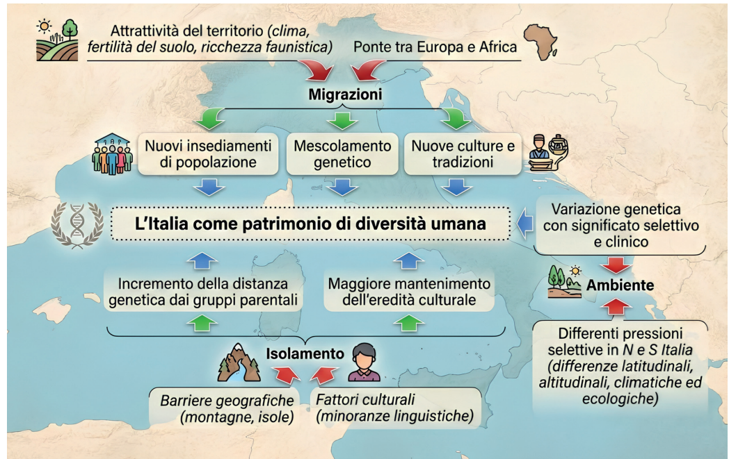
Figura 2. L'azione combinata di migrazioni, isolamento, sia genetico sia culturale, e delle pressioni selettive ha reso l'Italia un patrimonio di diversità umana (si veda "Gli italiani che non conosciamo", 2024, pp. 277-280, per una spiegazione dettagliata).

si sarebbe potuti aspettare viste le loro affinità. Possiamo pensare, ed ecco i fattori sociali, che il senso di appartenenza (il quale condiziona fortemente le scelte matrimoniali) si sia rivelato nel tempo più forte tra membri di ciascuna singola comunità che non tra il loro insieme, pur in assenza di barriere geografiche e linguistiche [4]. Questo scenario ci mostra, da una parte, come i fattori sociali possano plasmare l'eredità genetica in modi sorprendenti e inattesi e, dall'altra, come nella nostra specie radici culturali e storiche comuni possano convivere con la diversità genetica.